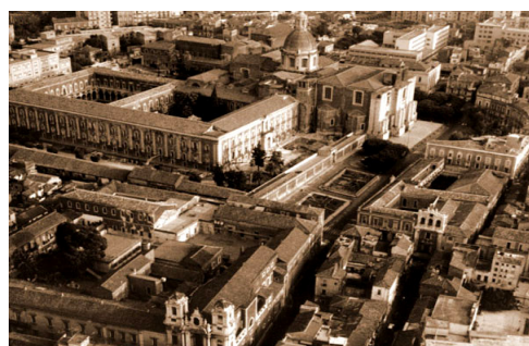
Palazzo dei Benedettini