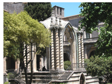
Chiostro dei Benedettini