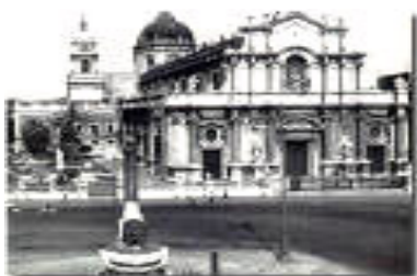
Duomo di Catania

È previsto il giro guidato nello stesso Monastero con i recenti scavi che hanno dimostrato la stratificazione delle varie civiltà, a partire dai sicani sino ai romani e della Biblioteca Ursino-Recupero, antica e ricca di preziosi arredi d'epoca ed incunaboli, sì da competere con le più antiche biblioteche italiane.